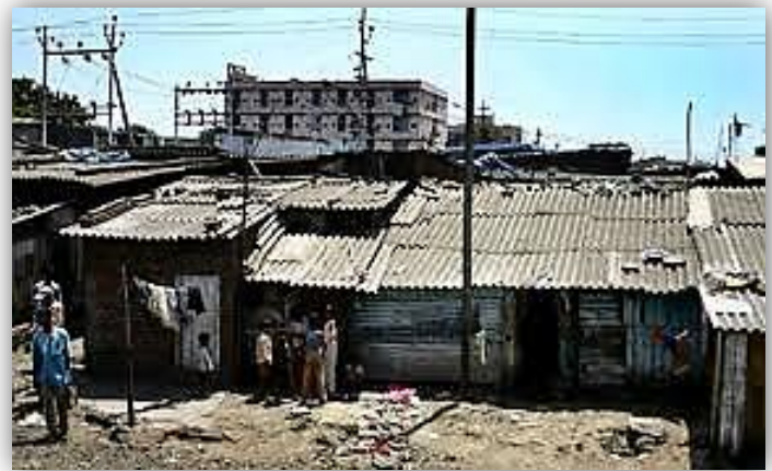
Doc 6 : un bidonville en Inde à Bombay

3) Recopie la phrase où l'on dit que les poissons et les plantes ont disparu des rivières.