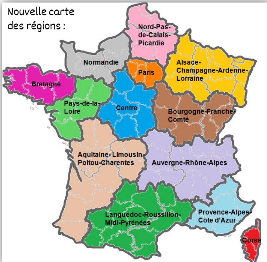
Nouvelle carte des régions :