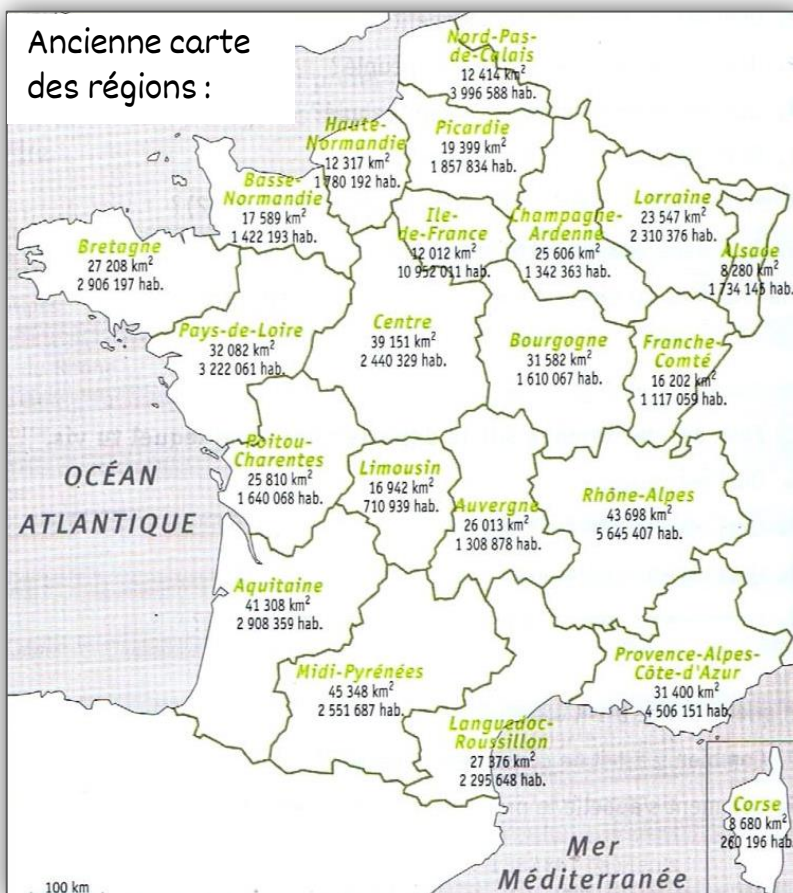
Ancienne carte des régions :